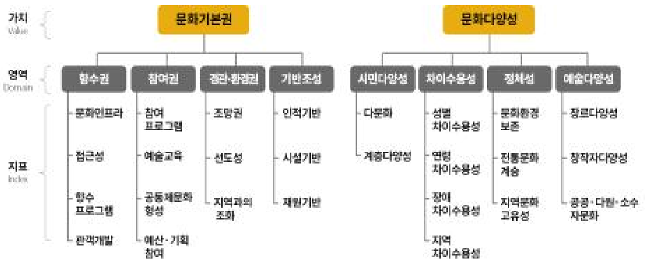
[그림] 서울시 문화영향평가의 지표모형