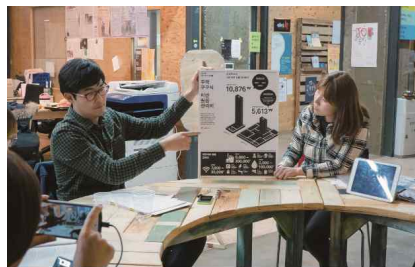
'15 청년연구 결과공유회 진행