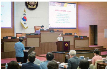
'14 청년기본조례안 발의