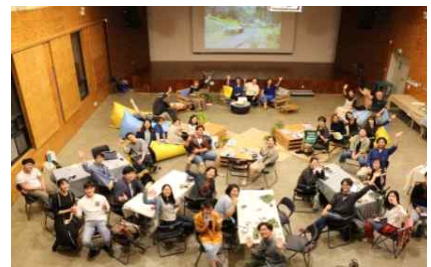
'16 청년학교 특강 진행