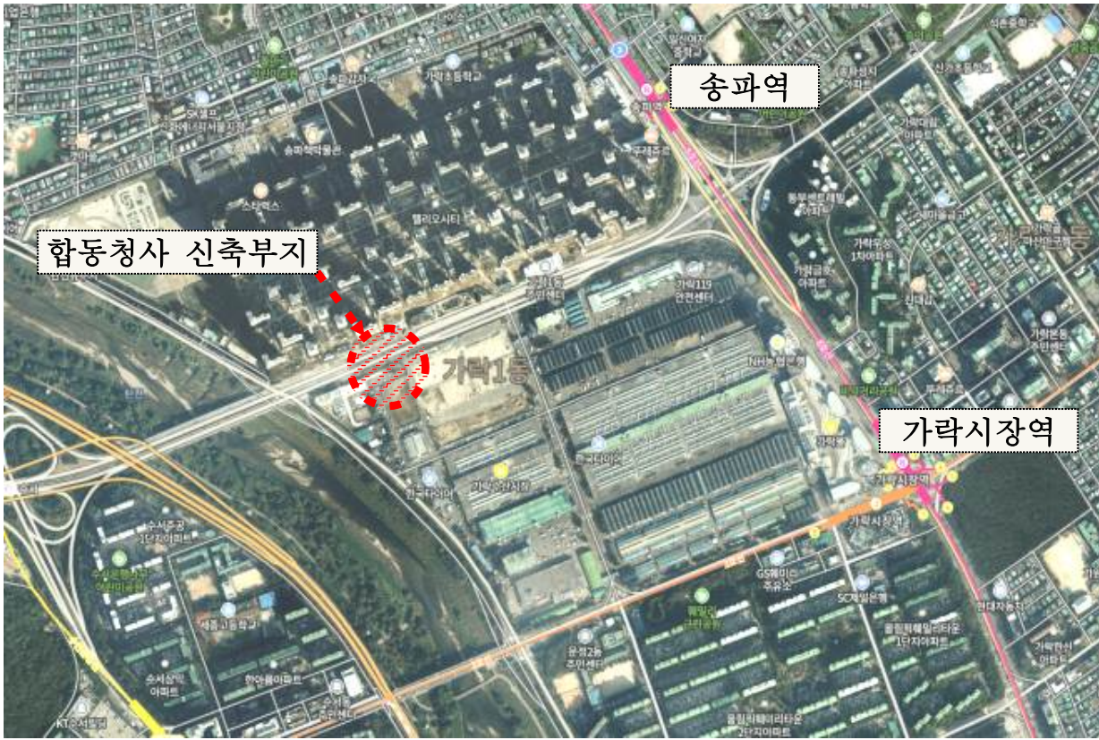
< 위치도 >