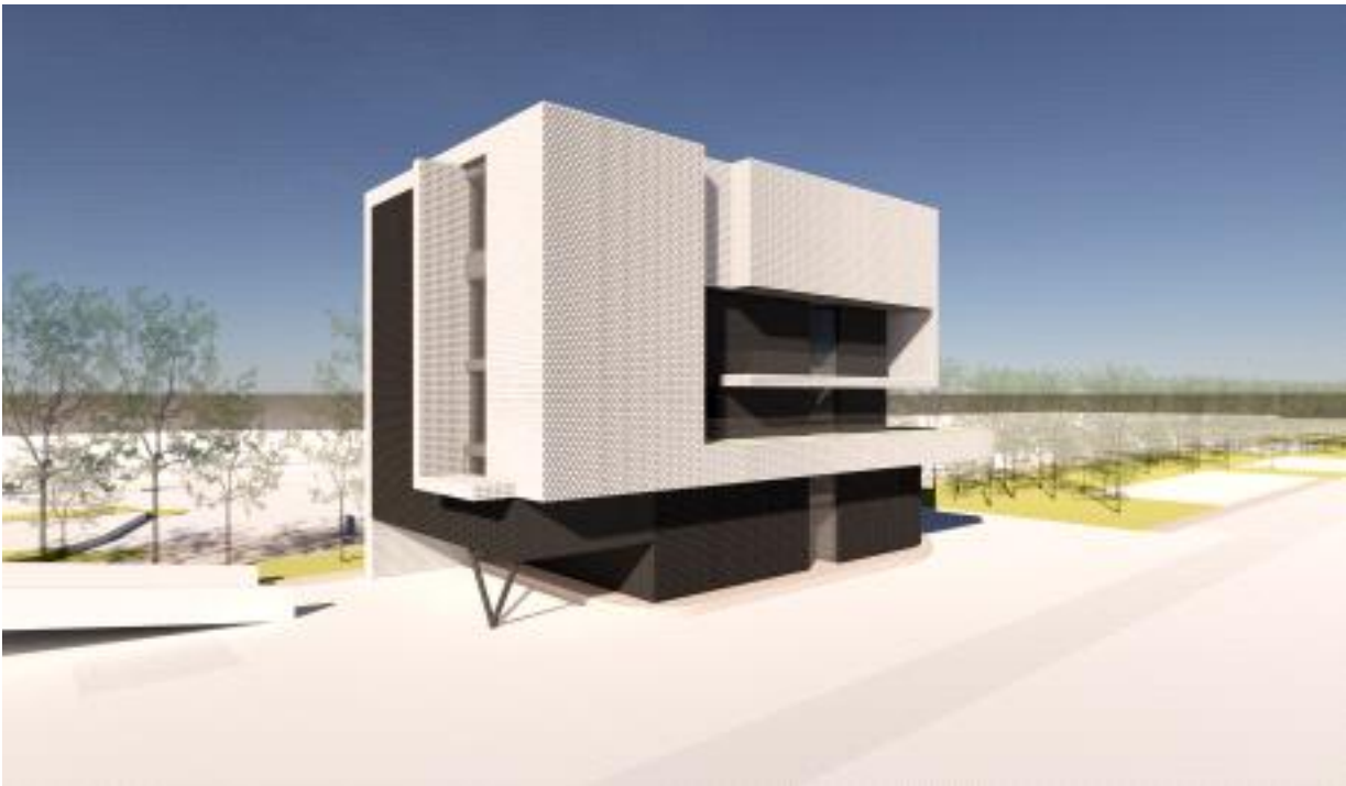
< 조감도 >