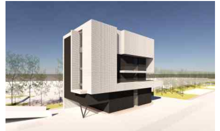
【 조감도 】