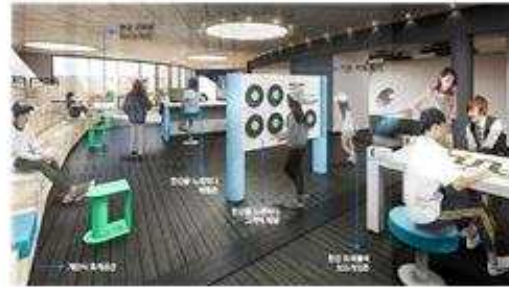
< 2관 문화체험 연출계획 >