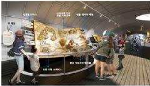
< 1관 역사전시 연출계획 >