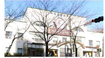
< 서울상도유치원 >