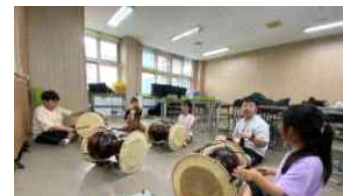
< 예체능·디지털분야 멘토링 >