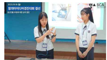
〈 창의아이디어 경진대회 〉