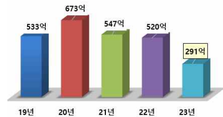
< 연도별 지원규모 >