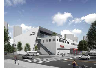
【 중랑청소년문화의집 】