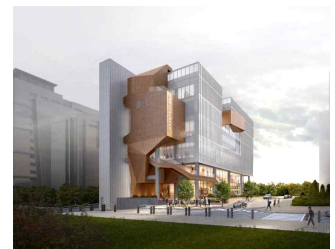
【 시립청소년음악센터 】