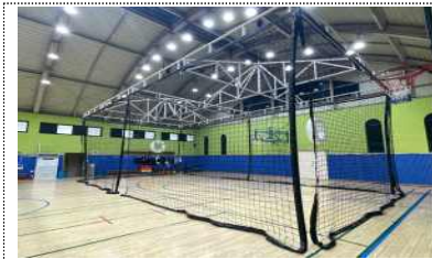
드론 축구 경기장(노원센터)