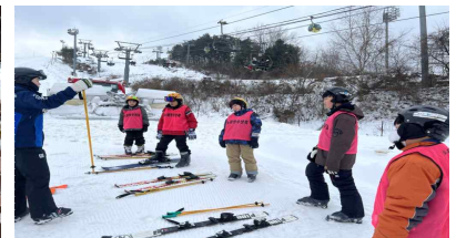
【 스키 캠프 】