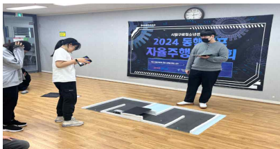
【 자율주행차 코딩 】