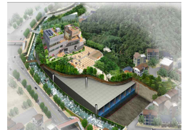
【 시립종로청소년센터 】