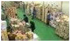
【 입고(검품) 】