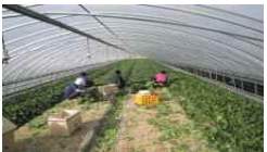
【 생산 】