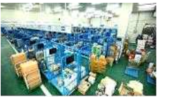
【 학교별 분류 】