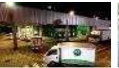
【 출고·배송 】