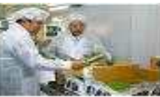
【 학교검수검품 】