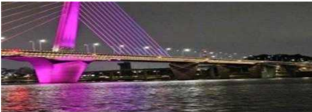
< 교각표시등 예시 >