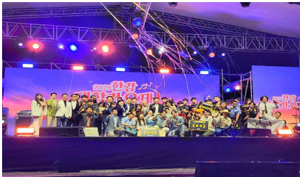
2025 한강 대학가요제 기념촬영