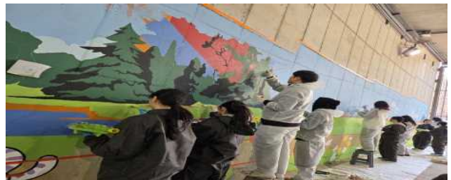
서울숲나들목 벽화 활동 (3.21~4.5)