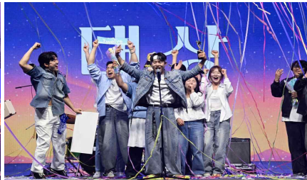
대상팀 시상 모습