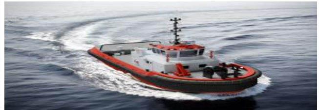
< 친환경 다목적 예인선 >