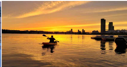
세빛섬 카약 체험