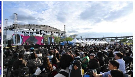
현장 관객 모습