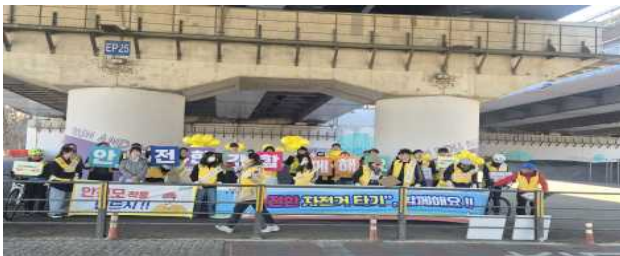
자전거 안전문화 캠페인(3월)