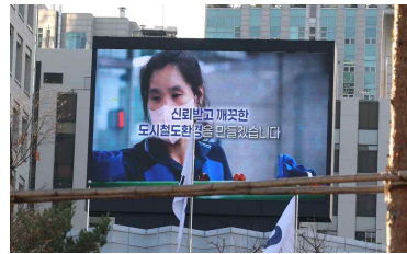
<서울시 120다산콜재단 공동홍보 MOU 체결>