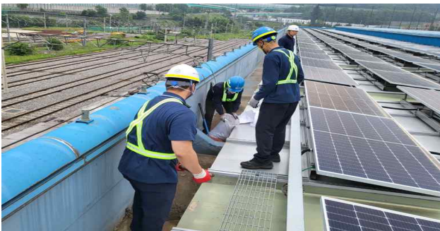
<사업장 내 위험개소 점검>