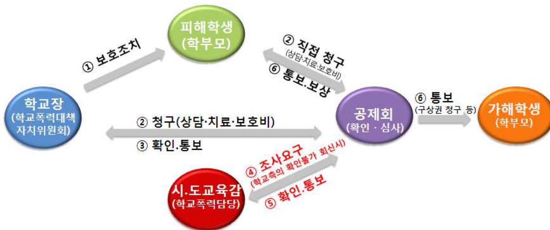
[그림 1] 학교폭력 피해 지원 업무 흐름도