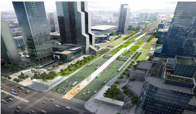
영동대로 복합개발 조감도