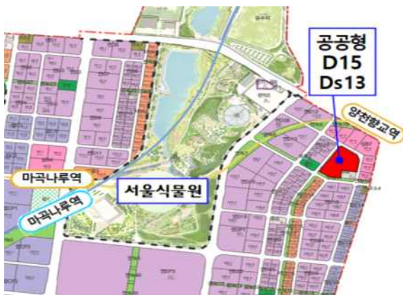
< D15, Ds13 위치 >