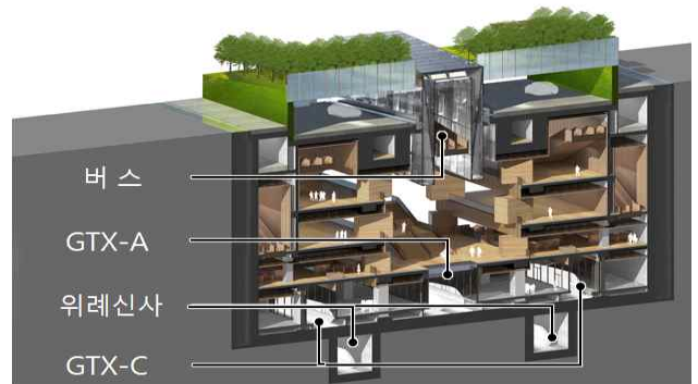
복합환승센터 건설 단면도