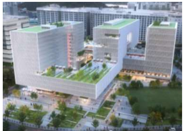
< 현상설계 공모작 >