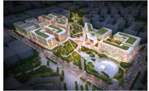
<마곡 MICE 복합단지>