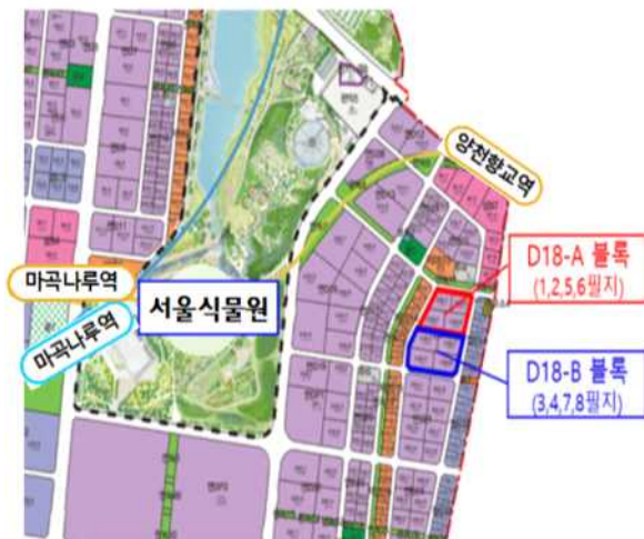
< D18-A 위치 >