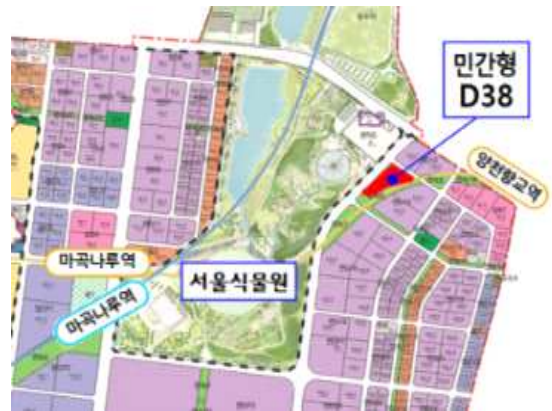
< D38 위치 >