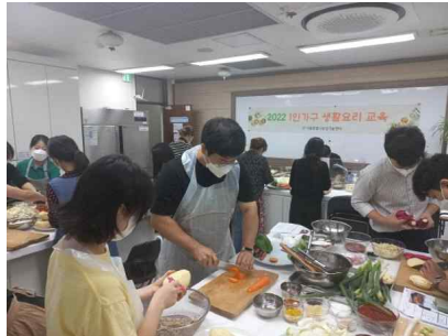
[1인 가구 생활요리 교육]