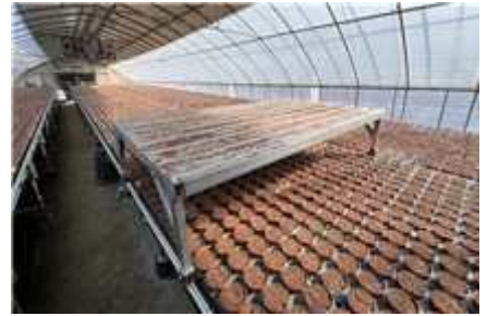
[ 고품질 화훼분화생산 베드시설 시범사업 ]