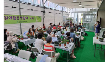
[원예활동 생활화 교육]