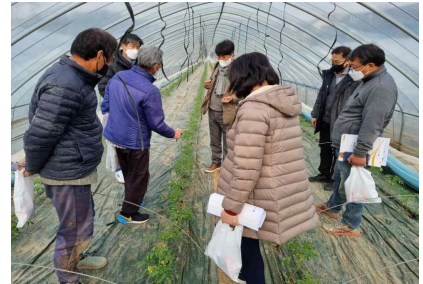
[친환경 품목기술 현장교육]