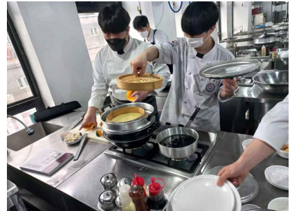
[우리 쌀 이용 전문교육]