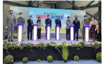
[제6회 대한민국 애완곤충경진대회 개막식]