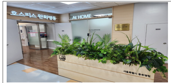
호스피스 완화병동 시설 개선