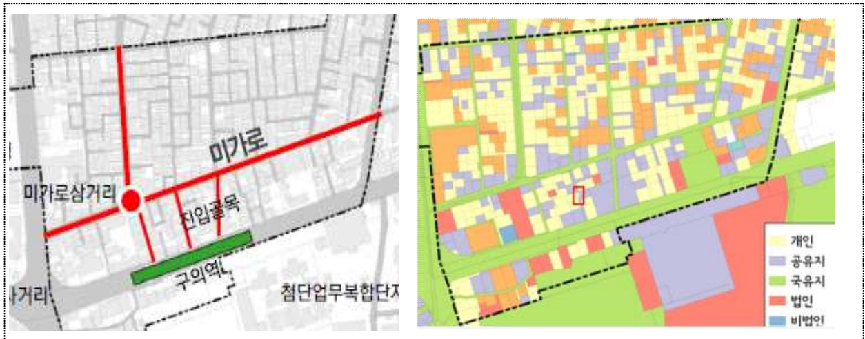
〈미가로 보행환경 개선사업(좌측) 진입골목 내 토지소유 현황(우측)〉