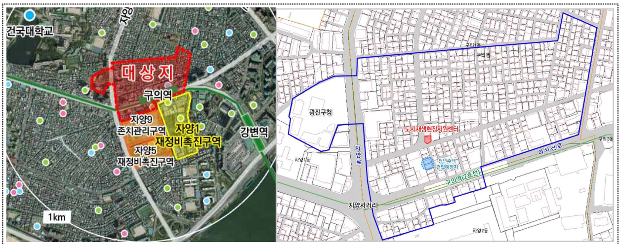
〈대상지 현황 및 구역계〉

반경 2km 내 건국대·세종대·장신대 등 대학기관이 위치하며, 주변에 한강(뚝섬한강공원)과 어린이대공원, 아차산 등 녹지가 분포하며 대상지 일대는 평지로 이루어져 있음.