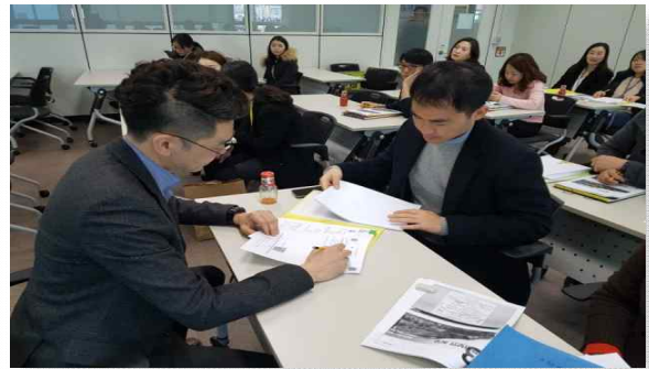
<양천구 총무계획 교육 및 지도>