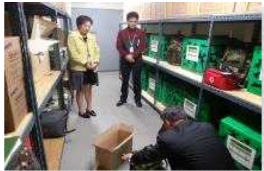
〈민방위 화생방 장비·물자 점검〉