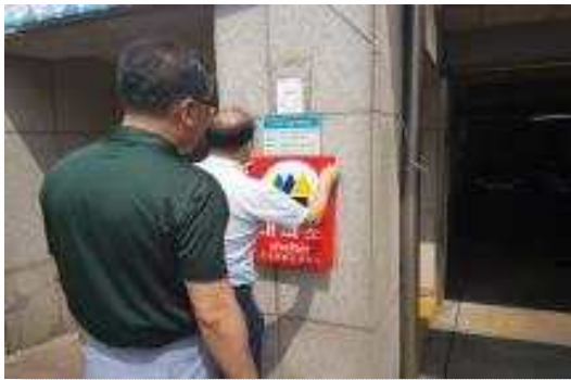
〈민방위 대피시설 점검〉

- 방독면 보유현황 : 175,241개 (목표 593,757개 대비 29.5% 보유)