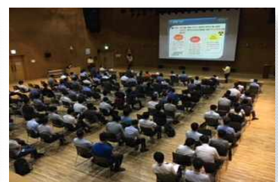
〈市 민방위대원 비상소집훈련〉