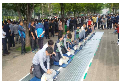
〈시청사 민방위의 날 훈련〉