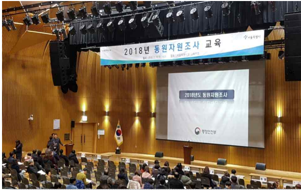
〈동원자원조사 실무 교육〉