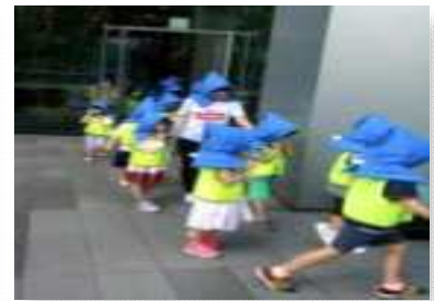
〈9월, 지진 대비 훈련〉