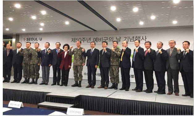
〈대외협력활동 (예비군의 날 행사)〉