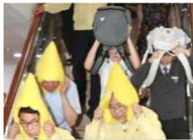
〈5월, 지진 대비 훈련〉