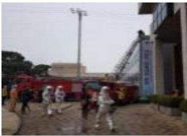
〈3월, 화재 대비 훈련〉