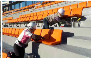
〈효창운동장 관람석 교체, 외벽 보수〉