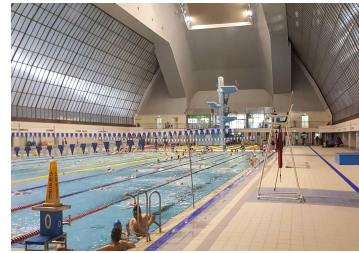
〈실내(좌측 연습플 방향)〉