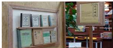
지식 공유 프로그램