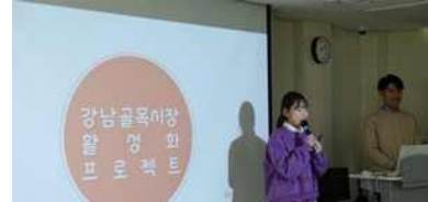
사회공헌 활동 연계