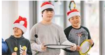
징검다리 프로그램 운영