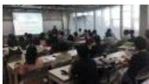
운영 및 모니터링