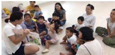
커뮤니티 활동 지원