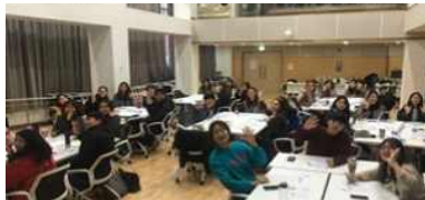
방법론 혁신 프로그램

– 시민스스로 공공성 있는 주제를 고민·해결하는 시민학교를 만들 수 있도록 돕는 시민학교 스타트업 공모·지원(13개팀 지원)