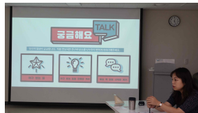
요구조사 프로그램 운영