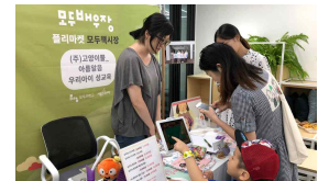
참여자 관리 프로그램 운영