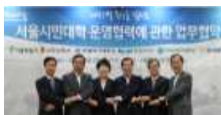
수요조사 및 협약체결