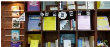
도서 매개 모임 활동