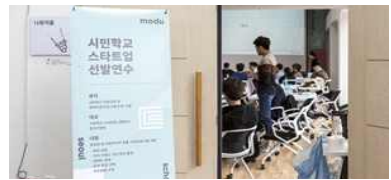
시민학교 스타트업 지원