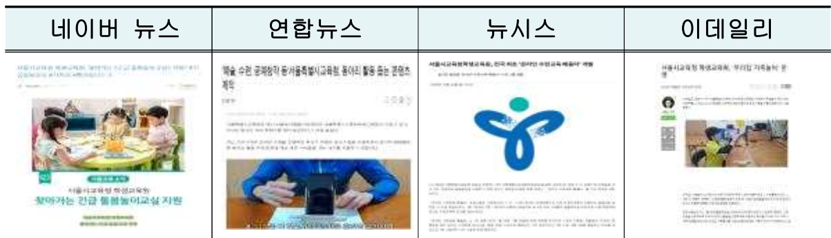
그 외 언론보도