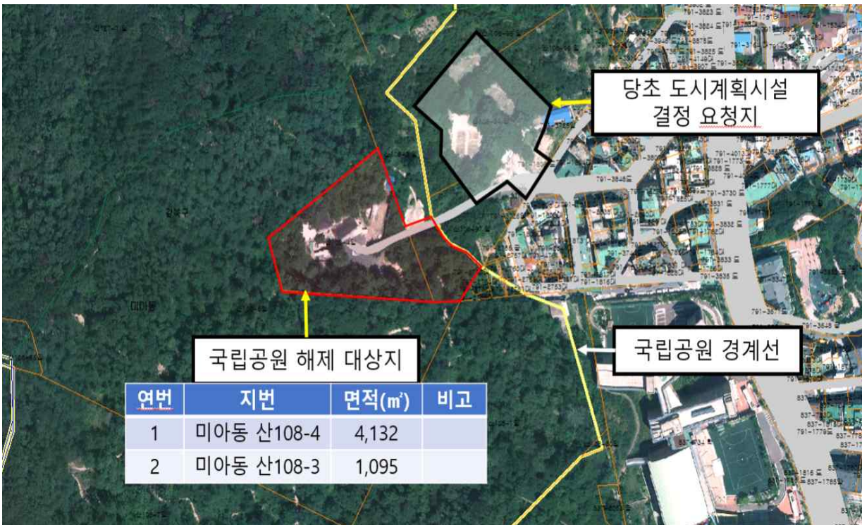
〈미아 배수지 조성 예정지〉

참고로, 최근 들어 자연공원 규제 개선을 목적으로 「자연공원법 시행령」이 개정 예정 7) 으로 빠르면 내년부터 도시계획시설 결정 및 토지보상이 가능할 것으로 전망되므로 환경부와의 협의를 강화하고 이에 따라 사업계획을 조정하여 배수지 건설이 조속히 추진될 수 있도록 만전을 기해야 할 것임.