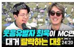
〈유튜브 '걱정말아요 서울'〉