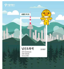
< 해치가 소개하는 서울색 >