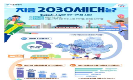
〈블로그 '2030세대 통계'〉