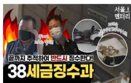
〈유튜브 '38세금 징수과'〉