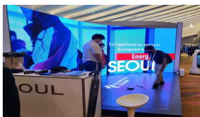
<WCS 서울시 홍보관>