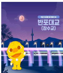
< 한강다리 시리즈 >