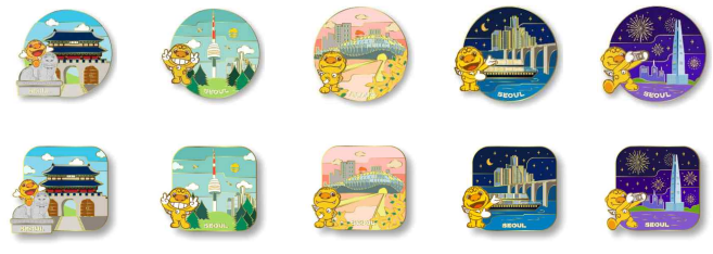
< 서울명소 배지 및 마그넷 >