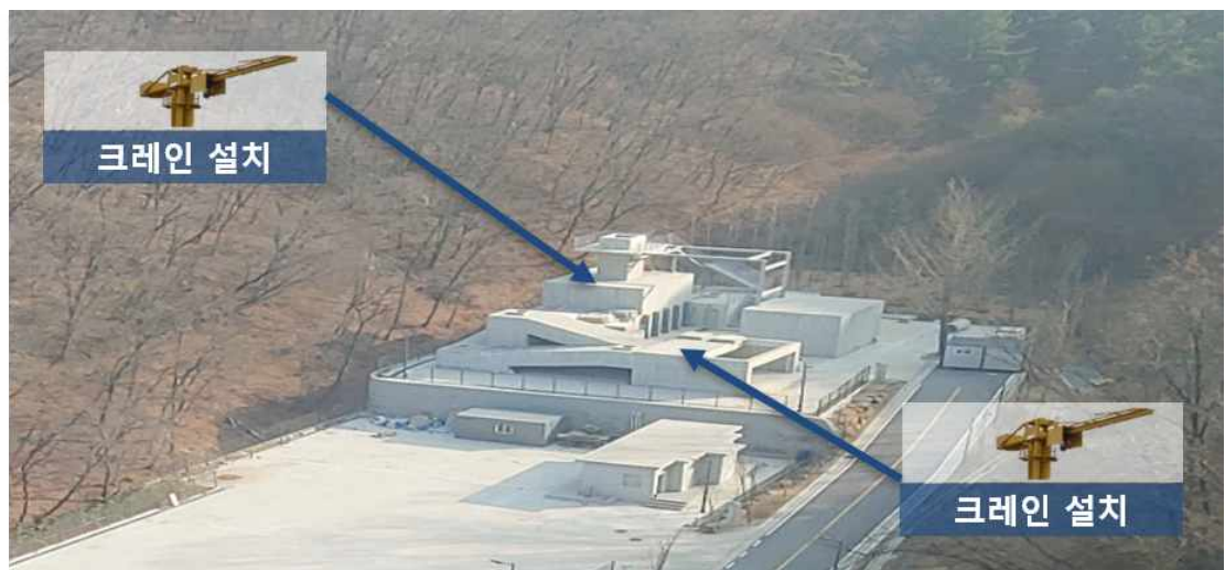
[그림] 도시탐색인명구조훈련장 크레인 설치 세부안