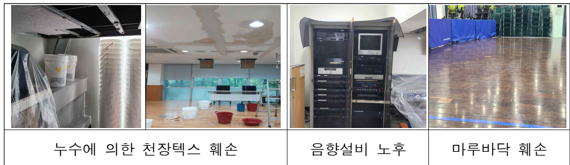
[표] 노원소방서 강당 누수피해 현황