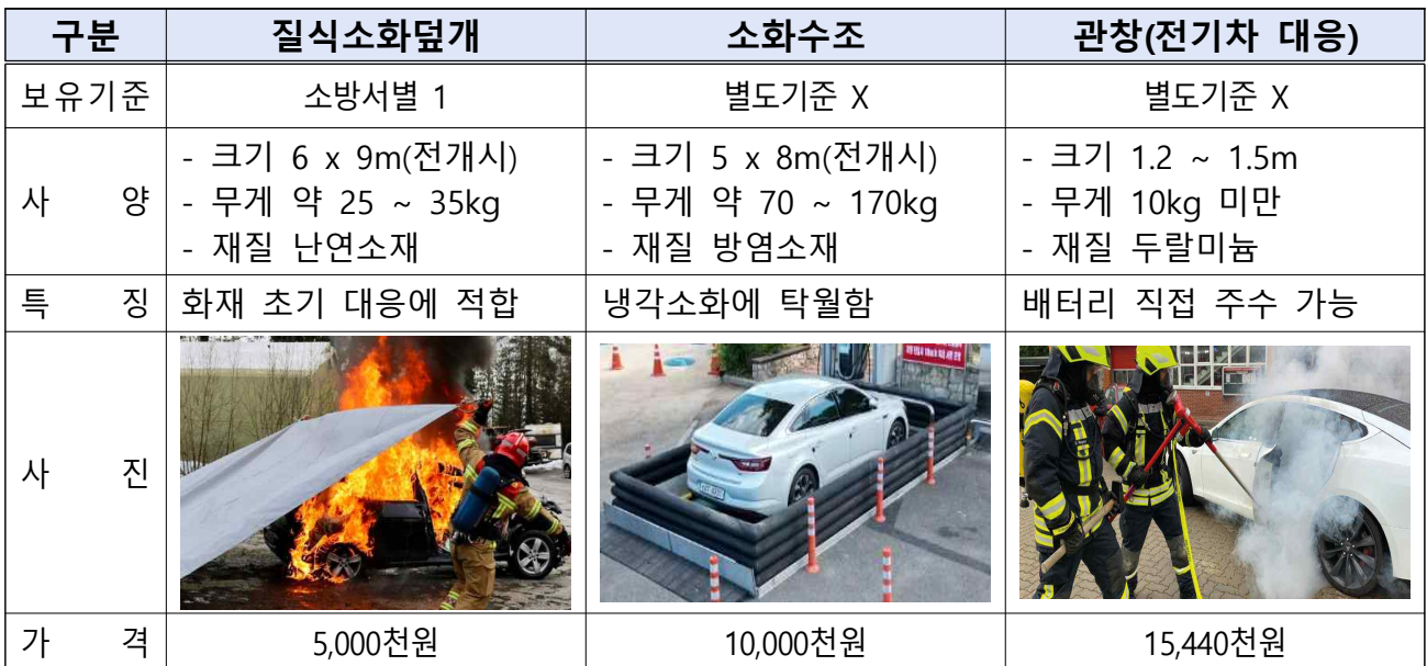
[표] 전기차 화재대응장비 제원 등