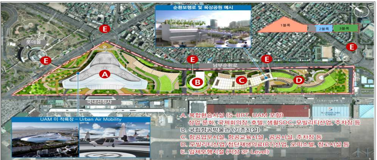
<혁신지구 건축물 배치도(안)>