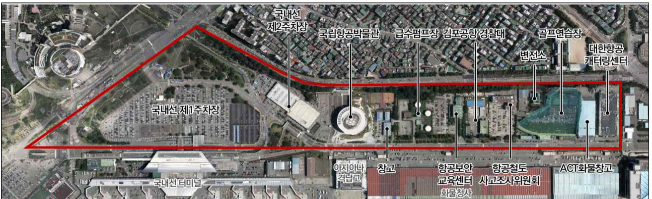
<김포공항 혁신지구 현황도>