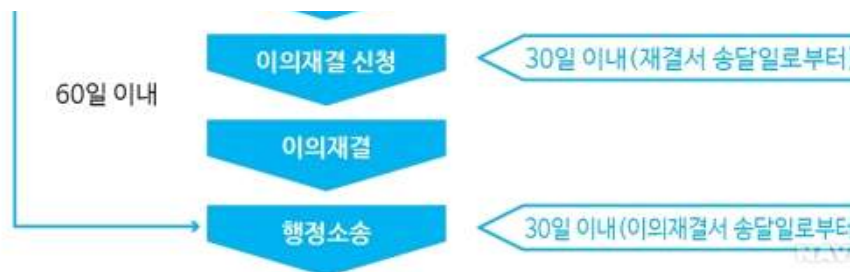
[그림] 보상평가 권리구제 절차