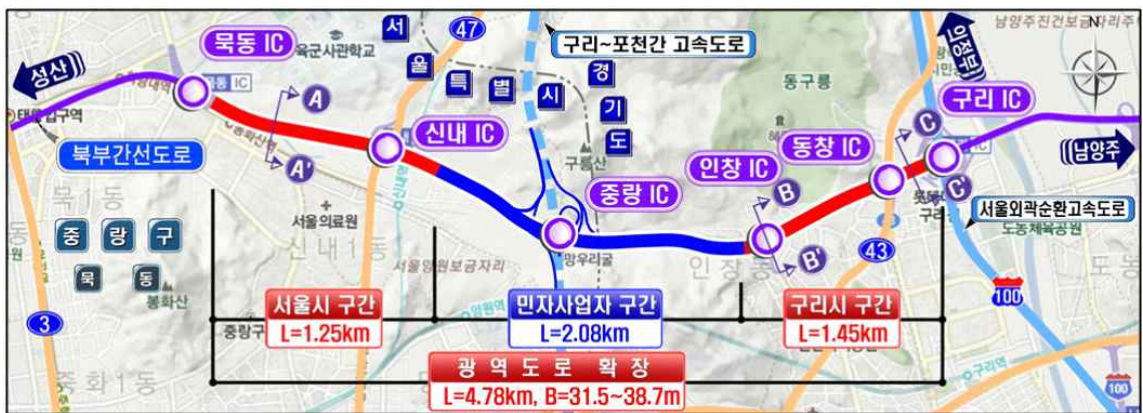
[그림] 태릉~구리IC간 도로확장 공사 위치도