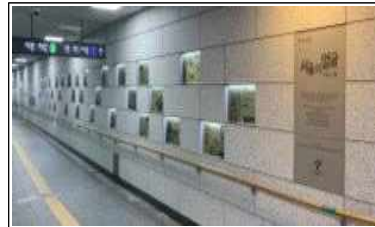
시민청 입구 「명예의 전당」 전경