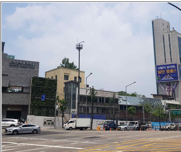
수직정원 대상지 원경