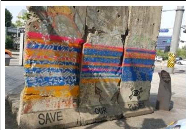
베를린 장벽 훼손 (2018년 6월)