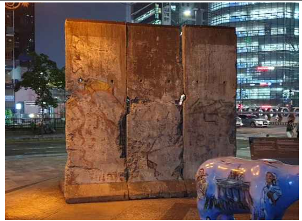
정비 후 (2020년 6월)