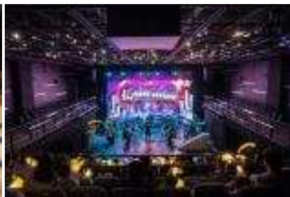
2021.5.14.&15. 우리아이 첫 콘서트