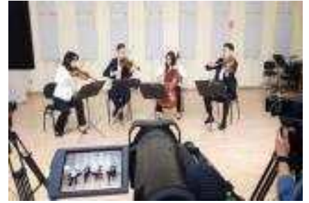
<현악4중주 마스터클래스 촬영>