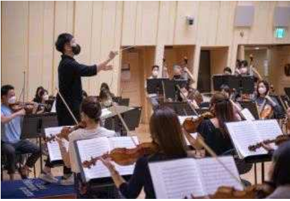
<'21년 지휘 마스터클래스>