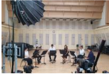
<목관5중주 마스터클래스 촬영>