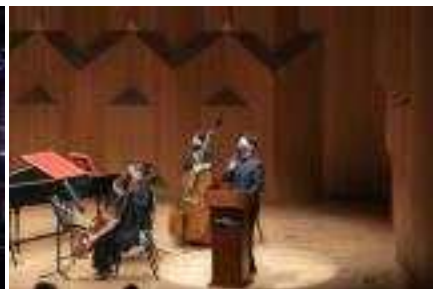
2021.9.18. 행복한 음악회, 함께!2