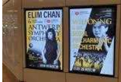
홍콩아트페스티벌 현지 홍보