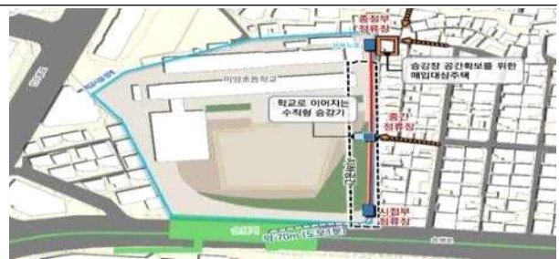
< 솔샘역 인근 >