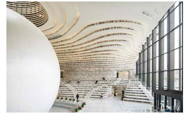
[도서관] 텐진 반하이 도서관 / 중국

▶ 과학문화미래관 건립 실행방안 수립 용역('18.12~'19.12) / 용역비 264백만원