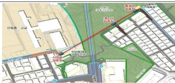
< 미아역 인근 >