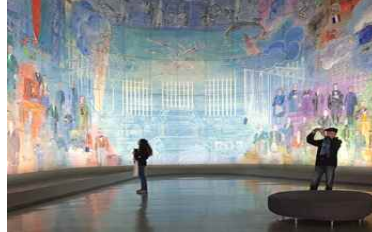
[문화예술] 루이비통 미술관 / 프랑스