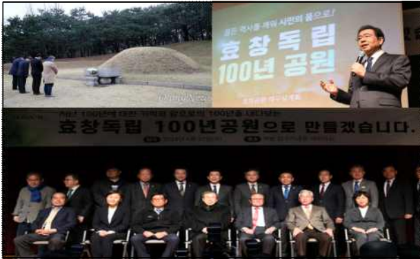
〈현장설명회 및 기자설명회 현장〉