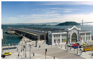
[과학관] 익스플로라토orium / 미국