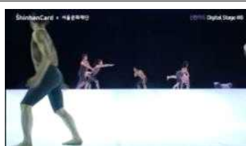
<언택트 공연 영상제작 지원 사업_신한카드>