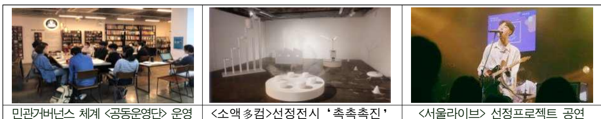
민관거버넌스 체계 <공동운영단> 운영