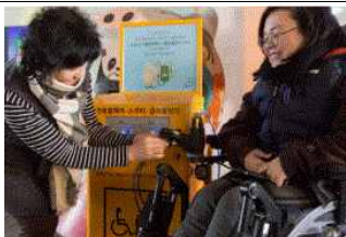
<전동휠체어 급속충전기 설치 지원_365MC>