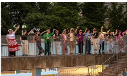
'24 서울시민예술학교 양천 봄시즌 무용 프로그램