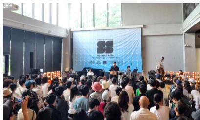
문화예술 공간 기반 공연 운영(노들섬)