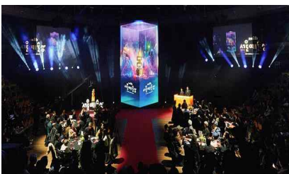
<제3회 서울예술상> 시상식