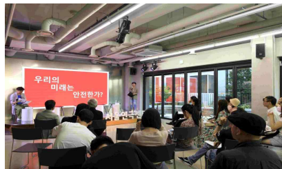
1층 라운지 행사 전경