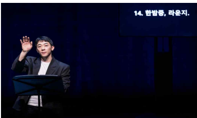
연극 <베를리너> 낭독공연