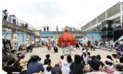
'24 예술힐링놀이터 인형 퍼레이드극