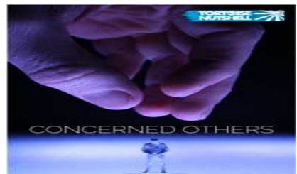
해외초청작 <Concerned Others> 포스터