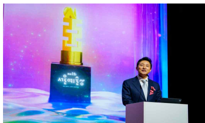
<제3회 서울예술상> 시상식 축사