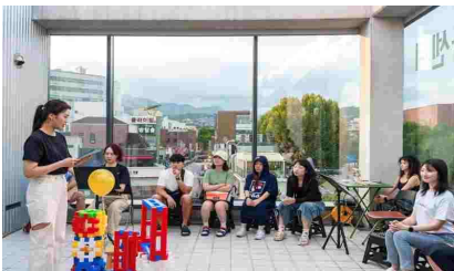
공간 개방 축제