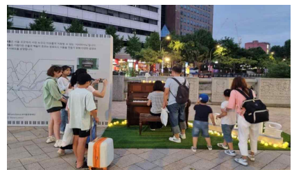
<피아노 서울> 시민 연주 모습(청계천_광통교)