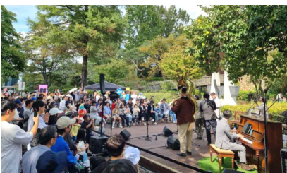
<피아노 서울> 찾아가는 공연 운영(어린이대공원)