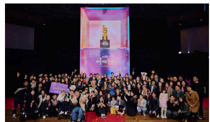
<제3회 서울예술상> 기념 사진