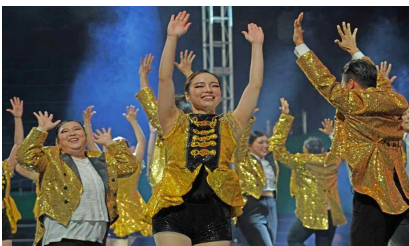
2024 서울생활예술페스티벌 동호회 공연