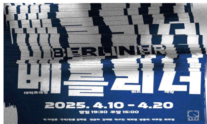
연극 <베를리너> 포스터