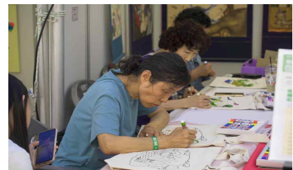
2024 서울생활예술페스티벌 시민체험 프로그램