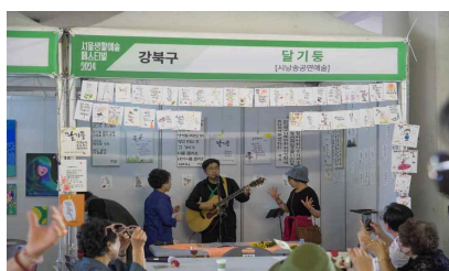
2024 서울생활예술페스티벌 전시 프로그램