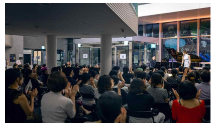
'24 서울시민예술학교 용산 가을시즌 음악토크콘서트

문화진흥본부장: 임미혜 ☎758-2003 예술교육실장: 이규승 ☎2004 작성자 서울문화예술교육센터용산팀장: 이유나 ☎3785-3188 담당: 최수연 ☎3194 서울문화예술교육센터양천팀장: 이정연 ☎2697-0011 담당: 이대욱 ☎0013