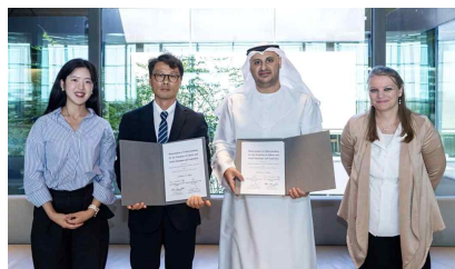
UAE 샤르자 투자개발청 업무 협약식