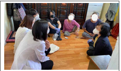
사후모니터링 환자 가정 방문