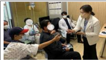
동네지원단 프로그램 '동네CLASS'