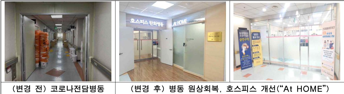
(변경 전) 코로나전담병동