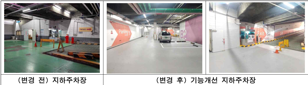
(변경 전) 지하주차장