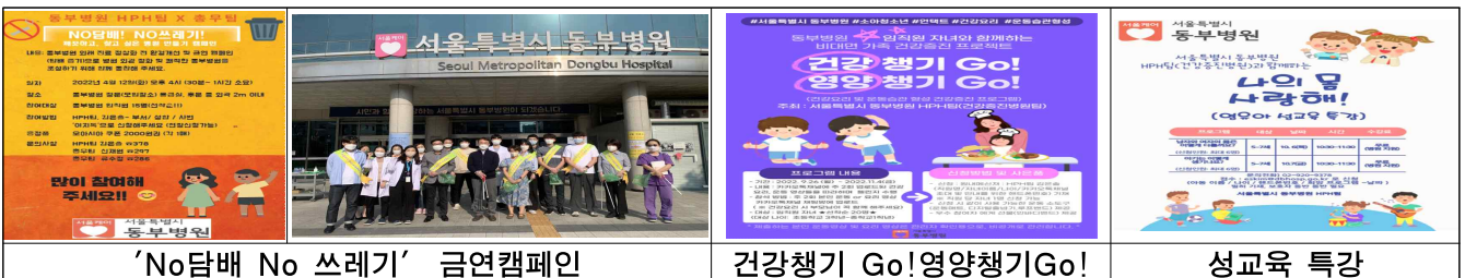
'No담배 No 쓰레기' 금연캠페인