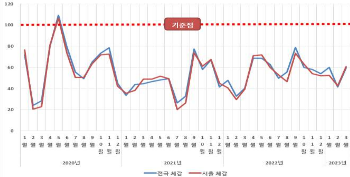
[표1](전국·서울) 전통시장 체감경기동향(BSI) 추이 (0≤BSI≤200)