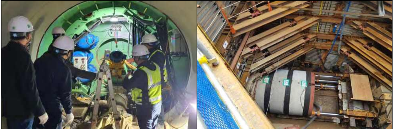
[그림 6] 사천 빗물펌프장 유입관로공사 현장 사진