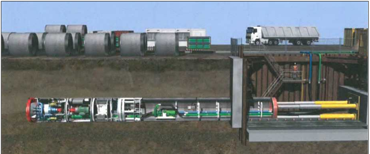
[그림 7] 사천 빗물펌프장 굴진장비 변경 공법(세미셴드) 개요도

- 현재 설계 및 공법을 변경하여 공사를 재추진하고 있으므로 기 집행된 예산의 매몰비용과 추가 설계비, 공사 지연에 따른