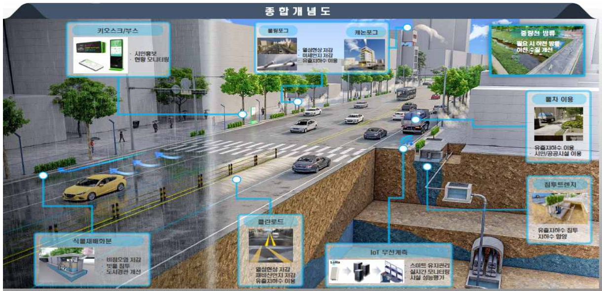
[그림 4] 스마트 물순환 도시 종합개념도