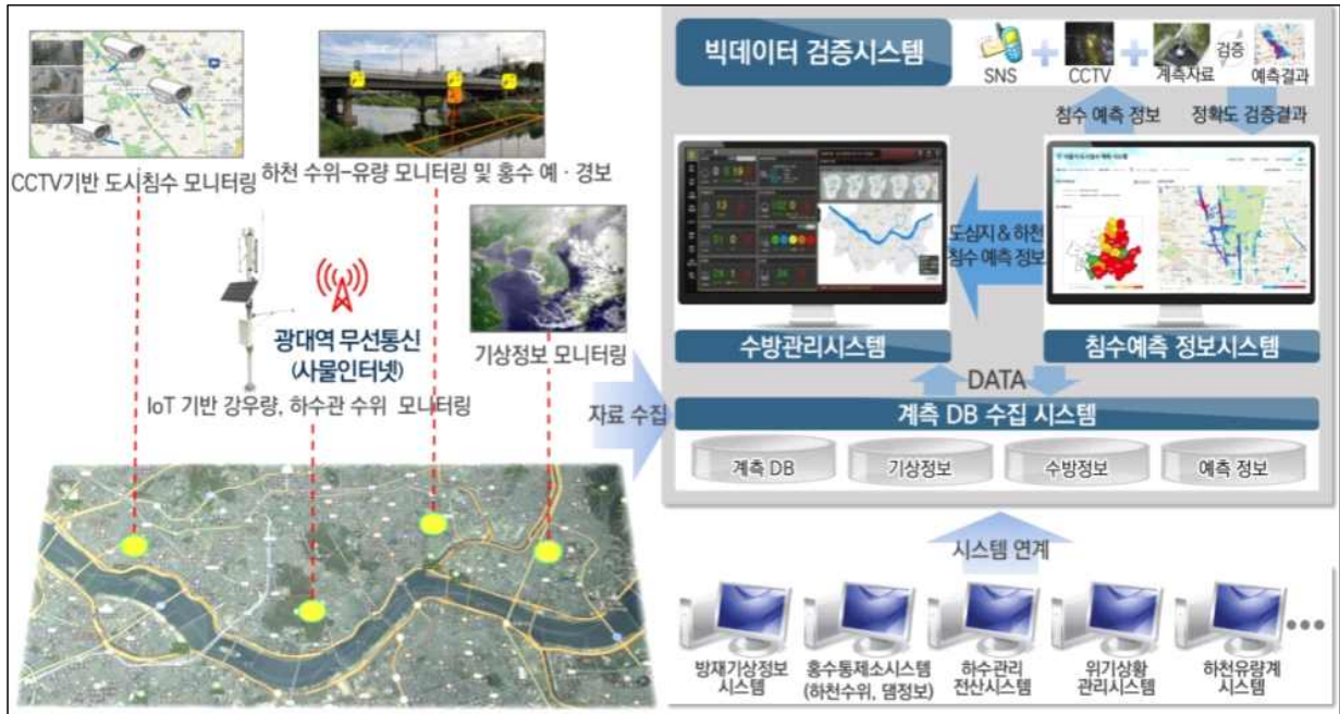
[그림 5] 침수예측 정부시스템 개념도(안)