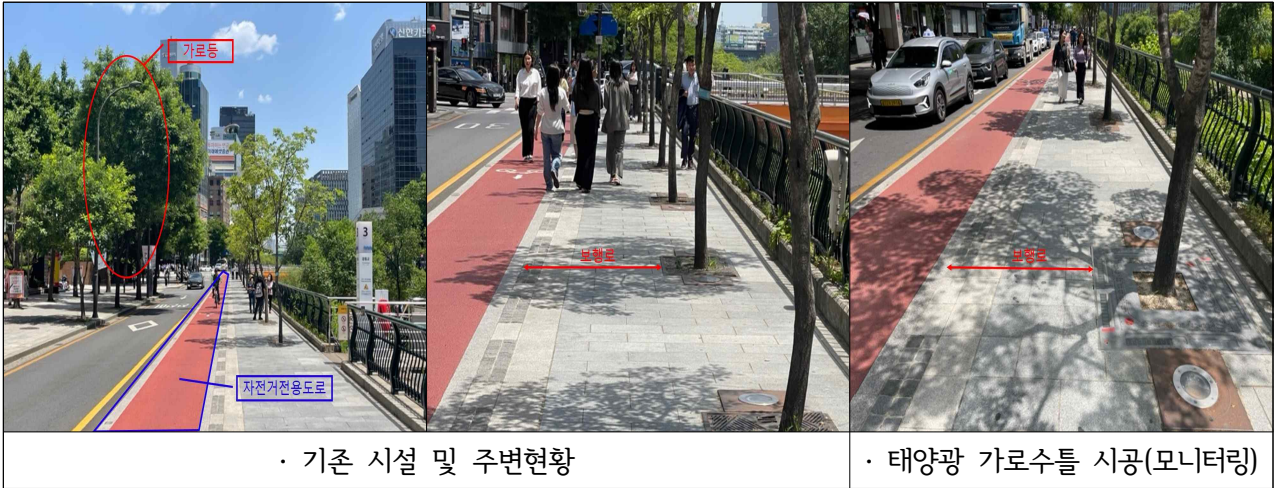
[그림 1] 청계천 가로수 보호틀(태양광) 설치에 따른 도로폭 감소 현황