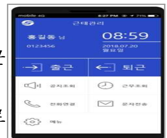
근태전산화지원시스템 최초 화면