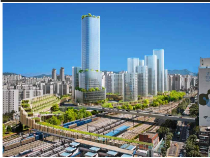
노원 광운대 물류시설