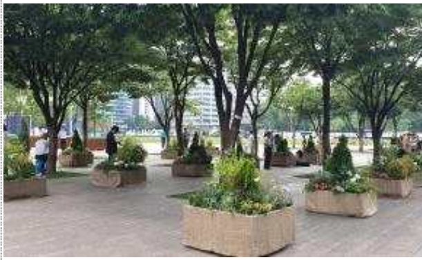
사진 1. 서울광장 (움직이는 정원조성 화분) [사각화분 50개]