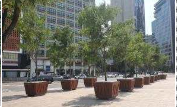
사진 2. 서울광장 (기업후원화분) [대형화분 20개]