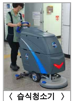
〈 습식청소기 〉