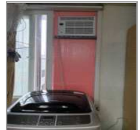
<휴게실 냉방기 설치>