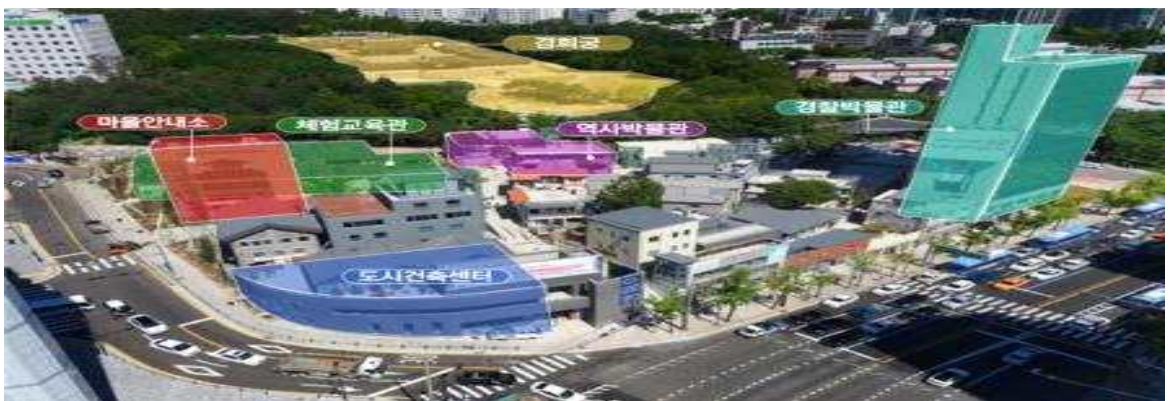
< 돈의문박물관마을 전경 >