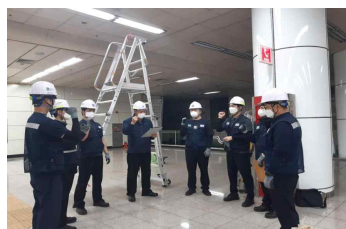
중대재해 예방 교육 실시