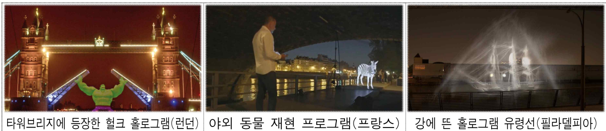
타워브리지에 등장한 헐크 홀로그램(런던)