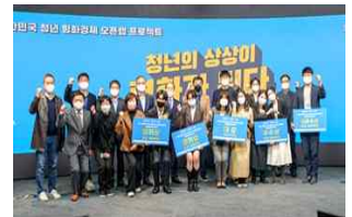
'21년 오픈랩 시상식