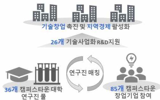
캠퍼스타운 기술매칭 2년 주요 성과