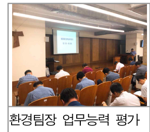
환경팀장 업무능력 평가