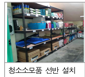
청소소모품 선반 설치