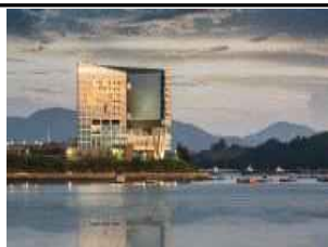
서남·근교권 임차연수원 4개소 54실 확충 (여수 히든베이, 여수 베네치아, 블룸비스타 양평, 엘리시안 강촌)