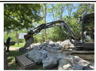
서천연수원 조경석 설치