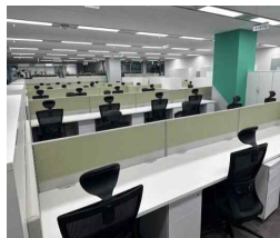
<노후 집기류 교체 전후>