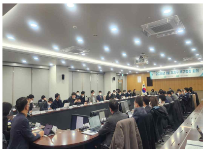
< 규제철폐 관련 부구청장회의('25.1.) >