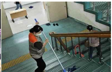
<노숙인 요양시설 청소>