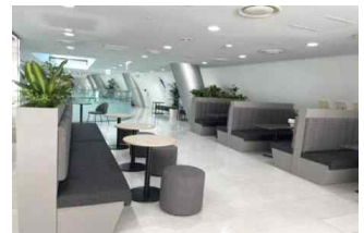
<본청사 회의 및 소통 공간>