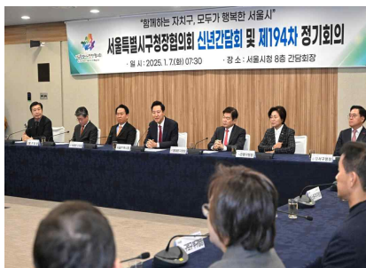
< 구청장협의회 신년간담회('25.1.) >