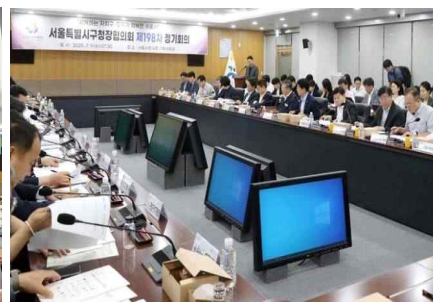
< 제198차 구청장협의회 정기회의('25.7.) >