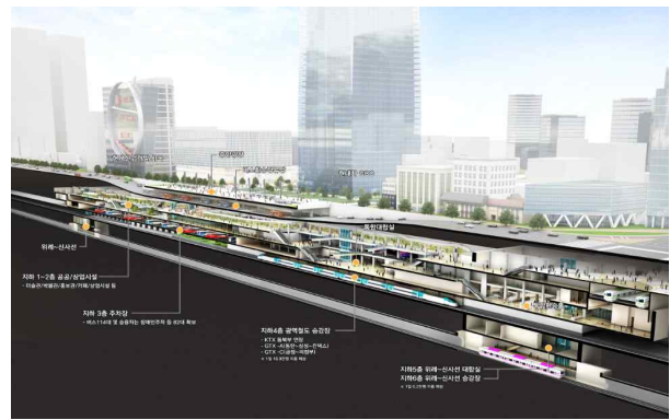
<영동대로 복합개발 횡단면도>