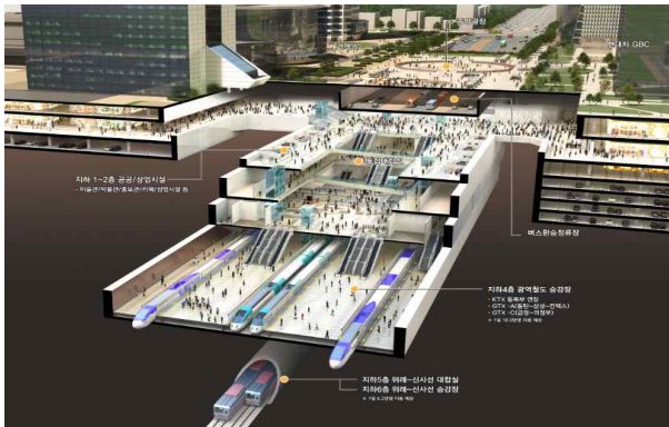
<영동대로 복합개발 종단면도>