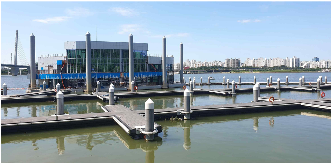
〈제320회 임시회 현장 방문 현황〉