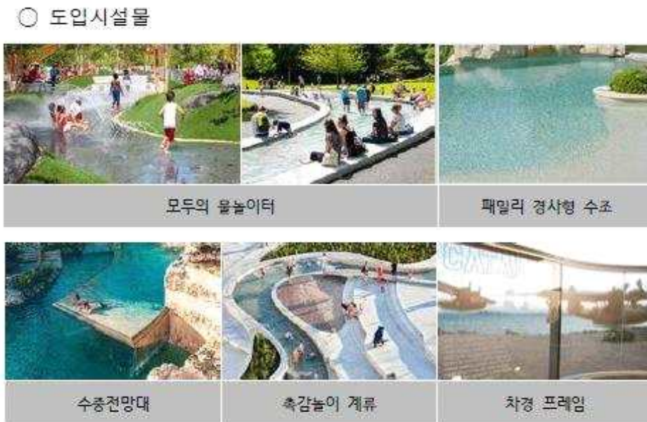
〈재조성 도입 예정 시설물〉