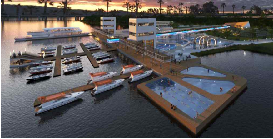
〈한강 아트피어 조감도〉