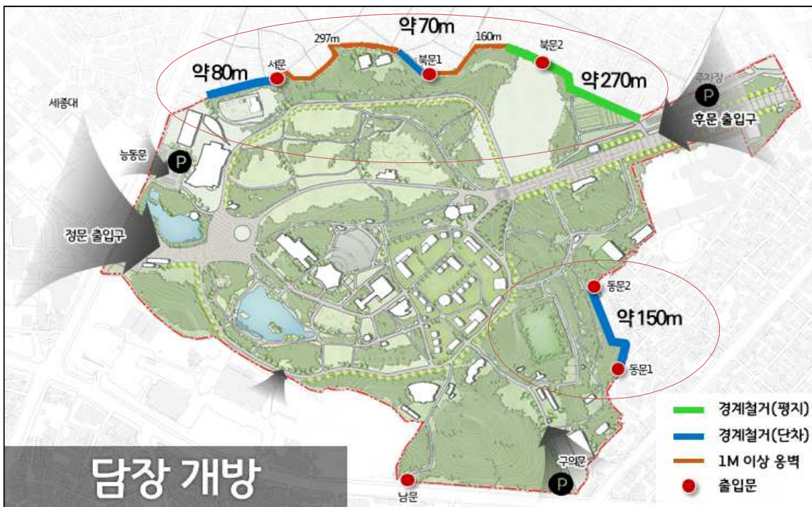
〈출입구·산책로 등 정비, 담장개방〉

무리하게 공간을 완전히 개방해 옹벽 전체를 없애는 토목공사를 수행하기 보다 지형을 적절히 이용해 다양한 경관의 공원을 조성하고 출입구를 선택적으로 조성하면 예산을 줄일 수 있을 것으로 판단됨.