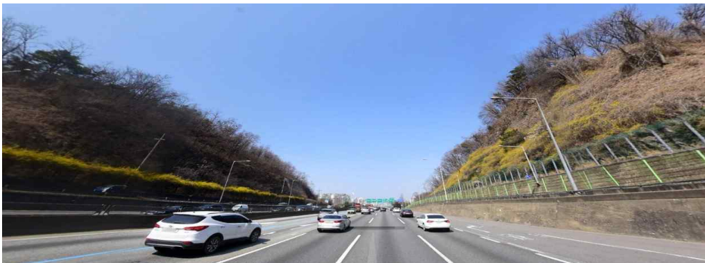
〈단절된 녹지축 양재고개 사업 대상지〉