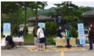
동물원 교육 프로그램