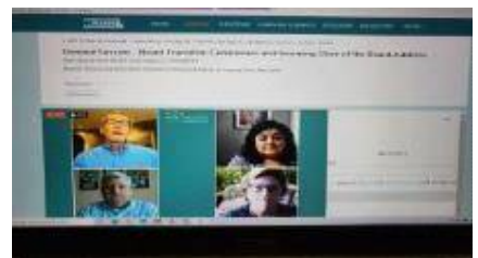
AZA virtual annual conference