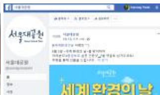
동물원 비대면 온라인 교육