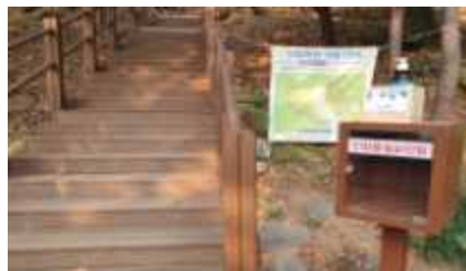
인화물질 보관함 설치(산림욕장)