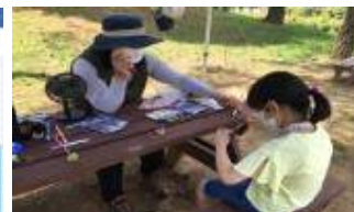
산림 교육 프로그램