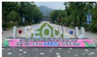
〈 대공원 진입로 〉