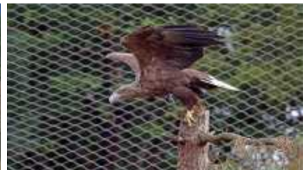
국제적 동물복지수준 제고