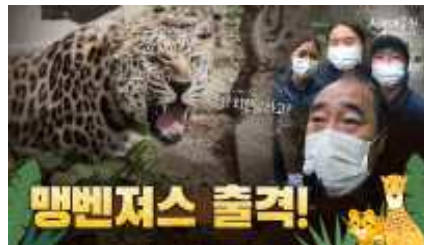
〈 온라인 콘텐츠 확대 〉