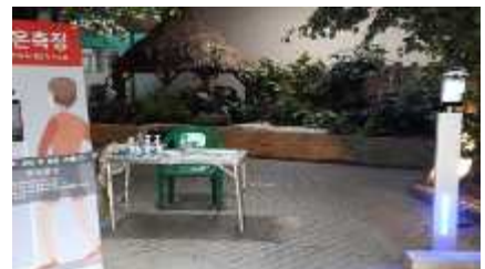
〈 동양관 입구 발열감지 체크 〉