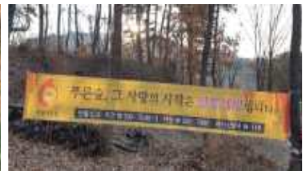
산불조심 현수막 게첨