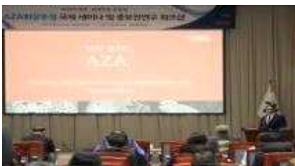
AZA회장 초청 국제세미나