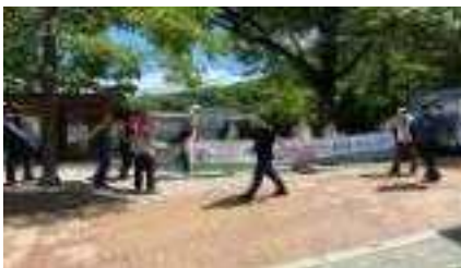
등산로입구 산불방지 캠페인