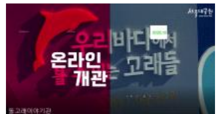
돌고래이야기관 온라인 개관