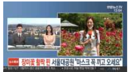
〈 코로나 대응 언론 취재지원 〉