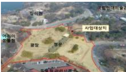
동물원 정문 및 광장 현황