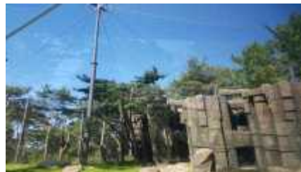
신규 맹금사 방사장