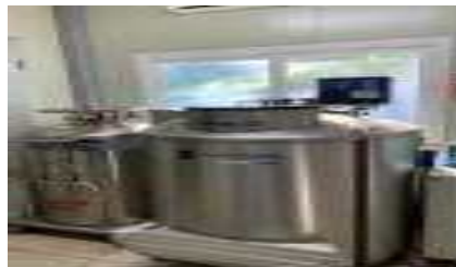
체세포 및 생식세포 보관소