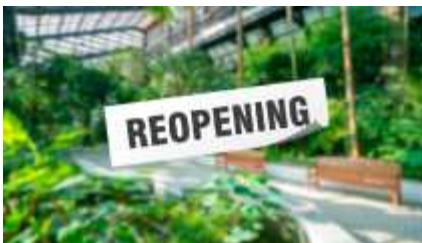
〈 식물원 오픈 〉