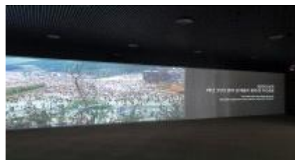
소중海 영상자료 상영관