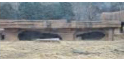
사자 방사장 온돌방석