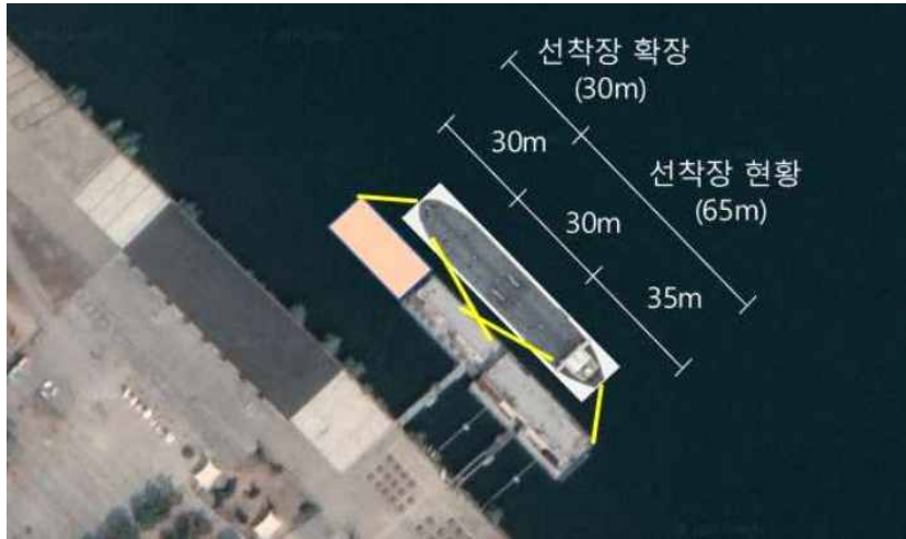
〈여의도선착장 확장 계획안〉