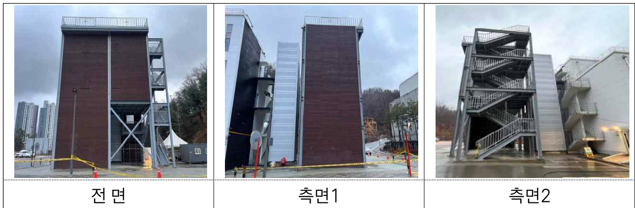
[사진] 특수구조대 다목적 인명구조 훈련장