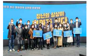
'21년 오픈랩 시상식